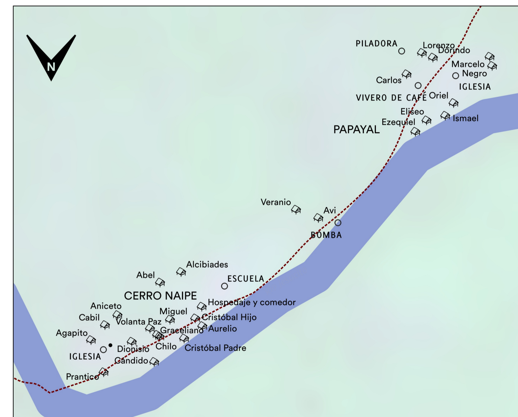
0 100 200 m Escala 1:2,750